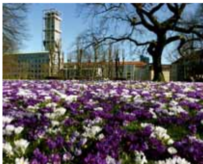
Blomstrende krokus foran rådhuset i Maribo efter samme model som græsplænen foran rådhuset i Aarhus.

De blomstrende bornholmsk røn, som Maribo kommune plantede i forbindelse med ombygningen af Vestergade. Billedet taler for sig selv i relation til hvad træer og blomster kan gøre ved en by.