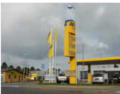
Velkommen til Maribo - det er ikke dette indfaldsvejsmiljø, der sælger byen i fremtiden.