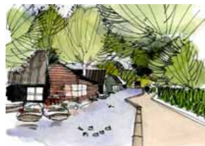
Ferieboliger ned til ålbøt i Maribo

Fremtidens cykelpakhus på Maribo Station, hvor cykelpendlerne kan parkere sikkert og få repareret cyklen mens man er på jobbet i København - eller cykelturisterne kan leje en cykel.