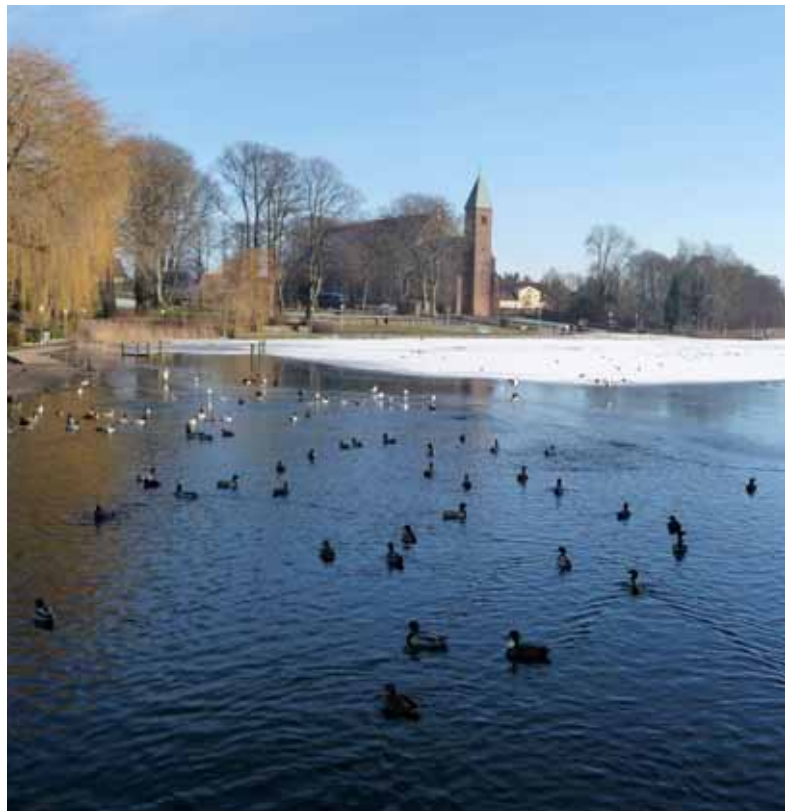
Den attraktive natur kommer helt ind i Maribo - og er en af byens største udviklingspotentialer